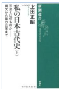
「私の日本古代史 上・下」 新潮社