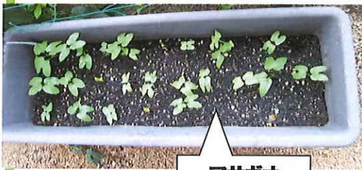
アサガオ (たくさん!)