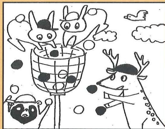
(但東で出会える動物たちだよ!)