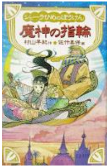
城崎分館司書☆イチオシ☆ 『シェーラひめのぼうけん』 (中学年向け)

豊岡市立図書館の本館・分館の司書が作成した、テーマ別ブックリストの本を展示しています。幼児・小学校低・中・高学年向けに、「しぜん」「ふしぎ」「ともだち」「たべもの」の4テーマで作りました。写真絵本や昔話、日本の作家や海外のロングセラーなど、楽しい本・読んでほしい本をリストアップしています。リスト用紙は、折りたたむと手のひらサイズの本の形になります。お気に入りの一冊をみつけてください。