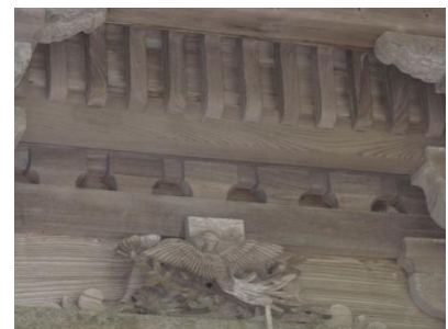
波や鳥を象った蕨股 (かえるまた) の見事な彫刻