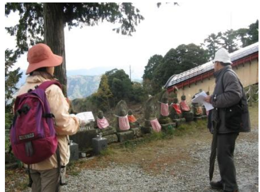
石仏（三十一番から三十三番がある）