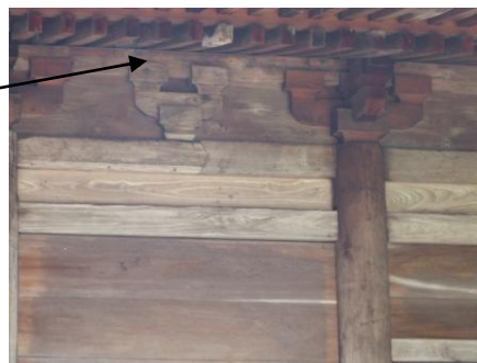
斗共 (お椀のような形をしたところ) 同様のものの椀を伏せた形が蕨股 (かえるまた)