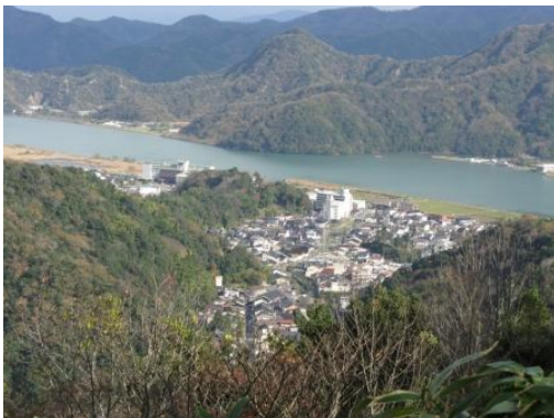
大師山山頂からの展望