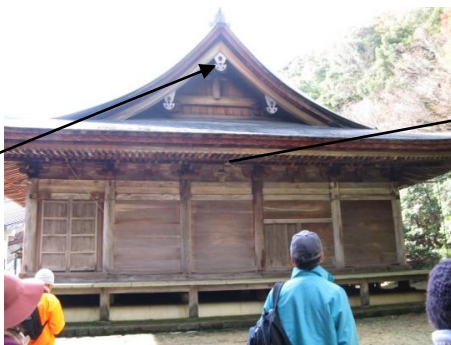
入母屋造り 銅板葺き